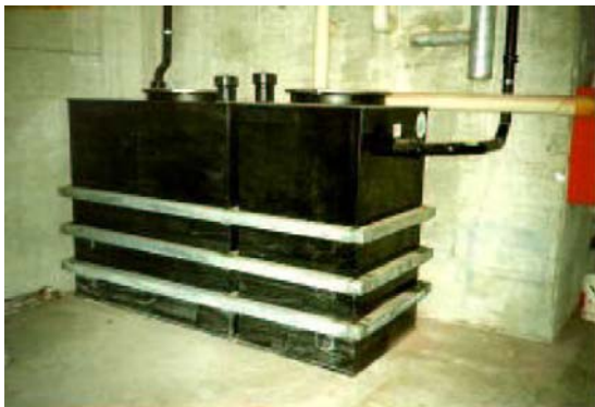
Separatore in HDPE autoportante di forma rettangolare