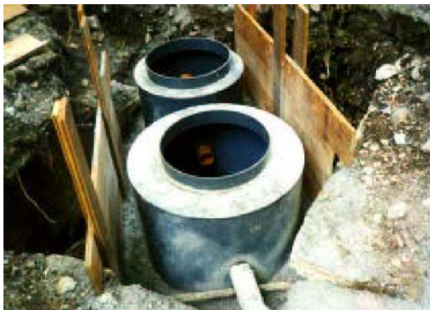
Separatore in PVC da rinfiancare In calcestruzzo di forma circolare