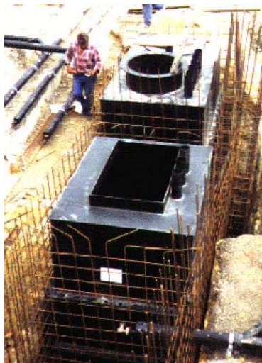
Separatore in HDPE da rinfiancare in beton di forma rettangolare