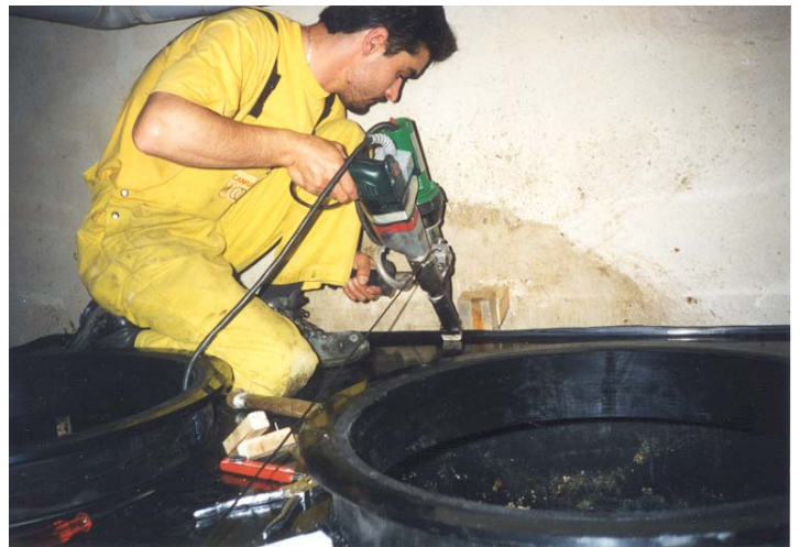
Montage sur place d'un séparateur

Les séparateurs ECOPLAST sont conformes aux normes SN 592000 et aux directives de l'Association Suisse des Professionnels de l'Épuration des Eaux (ASPEE).