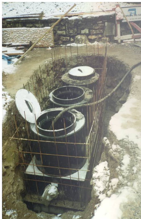
Séparateur à bétonner Château de La Tour-de-Peilz