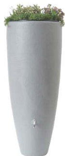
2 en 1