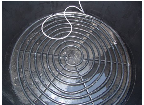
Vue du fond de la fosse avec le flexible 6 mm

Temps de traitement : Env. 30-40 min. par cycle de 1500 litres.